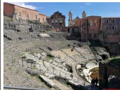
Teatro Greco Romano