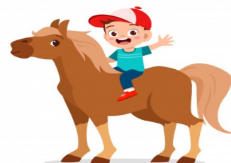
Pony..ed i suoi 5 sensi