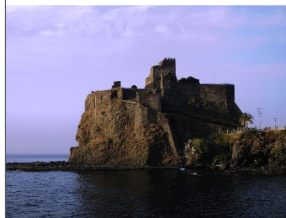
Castello Normanno di Aci Castello