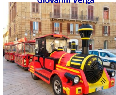
Tour in trenino a Catania