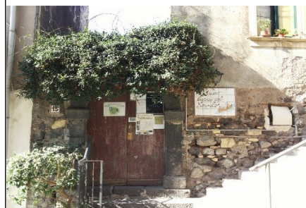
La Casa del Nespolo

Mattina: Accoglienza ore 09.00 presso l'antichissima "Casa dei Lupini" di "Padre N'Toni dei Malavoglia" con sosta e degustazione. A seguire visita al Parco Archeologico "Valle dell'Acì di Santa Venera al Pozzo. Sosta Pranzo. Nel pomeriggio, visita di Aci Trezza, borgo marinaro e luogo Verghiano, passeggiata panoramica guidata presso il suggestivo Lungomare dei Ciclopi caratterizzato dai celebri Basalti Colonnari dall'Isola Lachea e la "Riserva Marina Isole Ciclopi", con i suoi imperiali e maestosi Faraglioni, della naufragata barca "Provvidenza" e del "Museo Casa del Nespolo". Shopping.