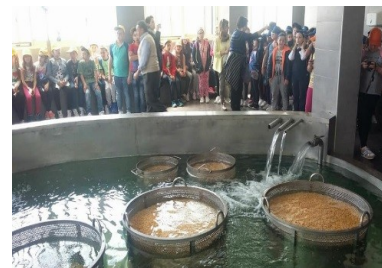
I Lupini da.... Reitano